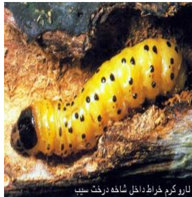
لارو کرم خراط داخل شاخه درخت سیب